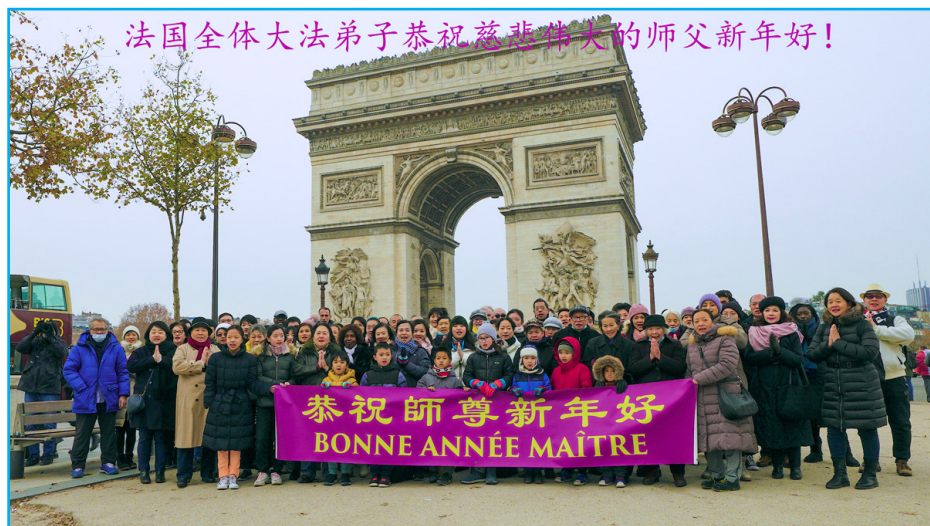
图：中国新年之际，为表达师父的敬意和感恩，法国巴黎部份法轮功学员齐聚凯旋门，恭祝师父新年好！感谢师父慈悲救度！