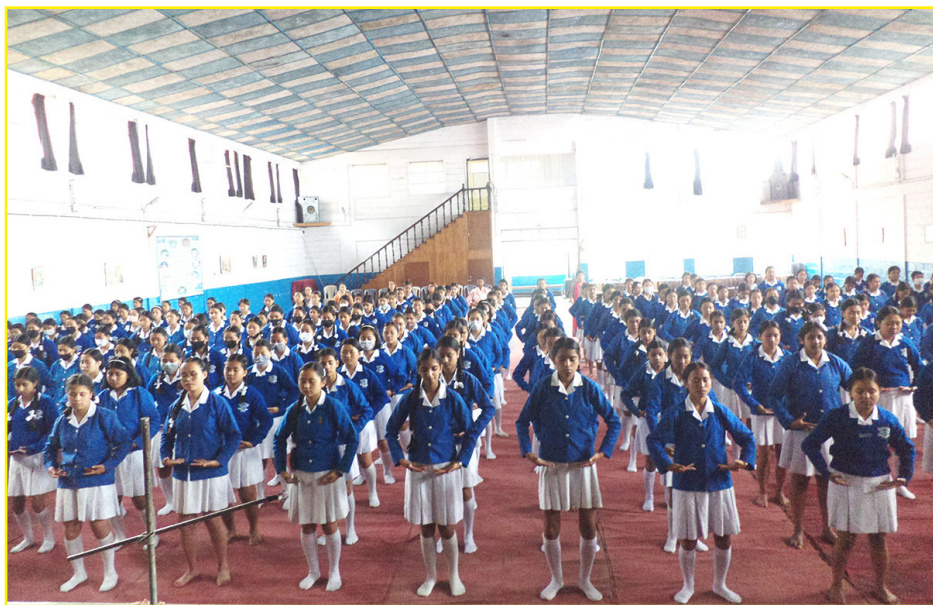
图：印度法轮功学员到喜马拉雅山脚的大吉岭地区，在当地十一所学校及一家非营利机构举办教功班，将法轮大法的美好以及中共血腥迫害法轮功的真相带给当地人。