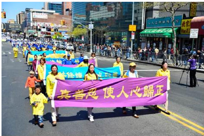
◇美国大纽约地区的部份法轮功学员与民众在纽约法拉盛举行大游行，纪念四二五和平上访。