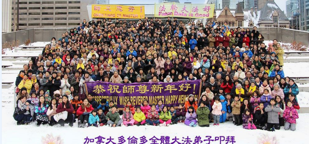
加拿大多倫多全體大法弟子叩拜