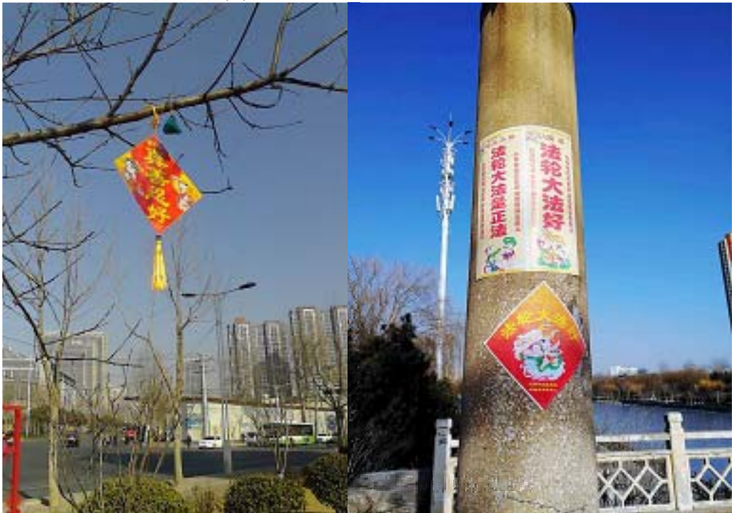
图：河北街头“法轮大法好”“真善忍好”粘贴、挂件

新年期间，北方的天气非常寒冷，有的地区降雪量大，三九天气温达到零下三十四度。无论天气多么寒冷，大法弟子都不忘记救人的使命，把“法轮大法好”的福音，过年好的祝福，三退保平安的信息等，以粘贴、树挂的形式带给父老乡亲，祝福善良人尽快了解真相。