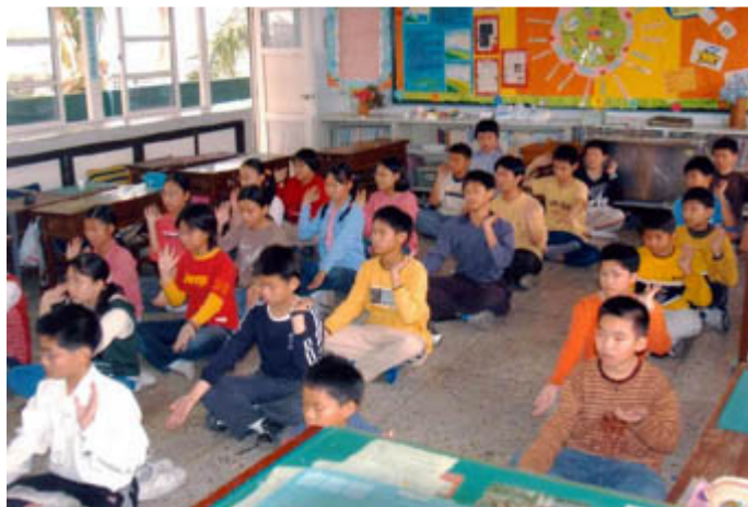
左图：台湾彰化市泰和国小六年甲班学生集体学炼法轮功