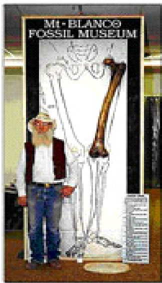
【正见网】美国德州 Mt. Blanco Fossil Museum 博物馆收藏的 2 公尺长的古人类大腿骨，据推算这腿骨来自公尺高的巨人

唯有周一路过老妇时动了恻隐之心：还是帮她摘一个吧，小孙子哭得这样，老妇又上不得树，我能摘到就摘，帮一帮她，试一试吧，之后再赶考。没想到就在他上了树伸手一摘的时候，桃树掉进一个仙人洞中。原来这里才是考神仙的山洞，一觉者扮化成老妇考考每个赶考人的善心。◇