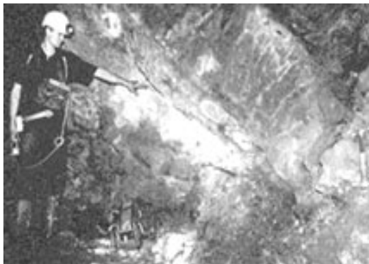
图:在加蓬共和国发现的远古核反应堆

二十亿年前曾存在大型核反应堆,这旁证了《转法轮》中关于史前文化的部分论述,却和达尔文的进化论开了个玩笑。按照进化论,人类的文明只有一万年,那么是谁建造了这个巨型核反应堆呢?另,天文科学研究发现,宇宙由4%的原子形态的真实物质、大约23%的看不见的暗物质和约73%的暗能量组成,一种未知的外来力量导致宇宙以不断加快的速度膨胀。NASA科学家说天上的事情和地上的事是有联系的。◇