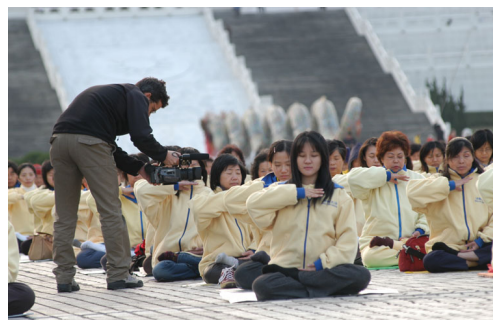
意大利记者在拍摄台湾法轮功学员炼功

埃塞俄比亚人权组织“为了人类行动者协会”（APAP）通过决议，谴责中国政府对法轮功的迫害，并要求立即停止杀戮，停止酷刑折磨法轮功学员，立即释放所有在押的法轮功学员；决议并敦促联合国人权委员会公开发表声明，谴责这场迫害，并要求中国政府立即停止迫害。◇