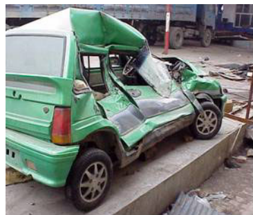
图：车子被撞后严重毁坏

这次遇难有惊无险是因为农历新年时妈妈给了我一个法轮大法好的护身符，我很珍惜的带在身上。我醒后，第一念就是问撞车的司机怎样了？当我知道都没事时心里很欣慰；我劝正在照顾我的四姨、老姨也修炼法轮功。在处理车祸事件上，我不要对方的钱，而告诉他们大法好。对方双手接过《转法轮》书，千谢万谢，处理事故的交警也亲眼见证了法轮大法的神奇。◇