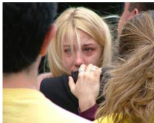
图：看到海外法轮功学员演示中国大陆学员所遭受的酷刑迫害而感到悲痛的女青年

据不完全统计，1999年7月20日至今，通过民间途径证实的至少有1571名法轮功学员被迫害致死，迫害致死案例分布在全国30多个省、自治区、直辖市。◇