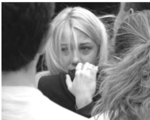
图：看到海外法轮功学员演示中国大陆学员所遭受的酷刑迫害而感到悲痛的女青年

据不完全统计，1999年7月20日至今，通过民间途径证实的至少有1571名法轮功学员被迫害致死，迫害致死案例分布在全国30多个省、自治区、直辖市。◇