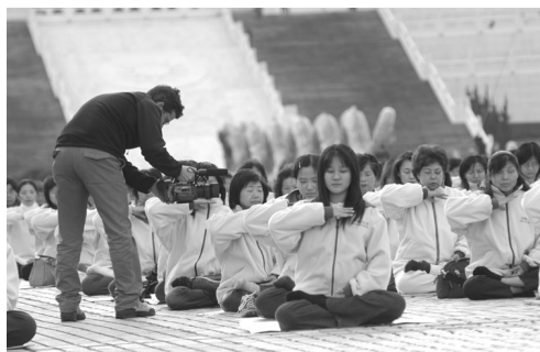
意大利记者在拍摄台湾法轮功学员炼功

埃塞俄比亚人权组织“为了人类行动者协会”（APAP）通过决议，谴责中国政府对法轮功的迫害，并要求立即停止杀戮，停止酷刑折磨法轮功学员，立即释放所有在押的法轮功学员；决议并敦促联合国人权委员会公开发表声明，谴责这场迫害，并要求中国政府立即停止迫害。◇