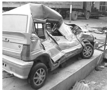
图：车子被撞后严重毁坏

这次遇难有惊无险是因为农历新年时妈妈给了我一个法轮大法好的护身符，我很珍惜的带在身上。我醒后，第一念就是问撞车的司机怎样了？当我知道都没事时心里很欣慰；我劝正在照顾我的四姨、老姨也修炼法轮功。在处理车祸事件上，我不要对方的钱，而告诉他们大法好。对方双手接过《转法轮》书，千谢万谢，处理事故的交警也亲眼见证了法轮大法的神奇。◇