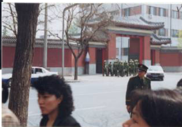
右图：和上访群众隔街相望的是中南海西门（这里可以看到紫禁城的红色围墙）

编者：从这些图片中我们很难看出“围攻”，而且上访的地点也不是中南海，而是相邻中南海的“西安门大街”，是当时国务院信访局的所在地。中国设立信访制度的本意，是为了使群众疾苦有一个下情上达的渠道。上万名群众直接来到国家最高的信访部门，这在中国历史上还是第一次。◇