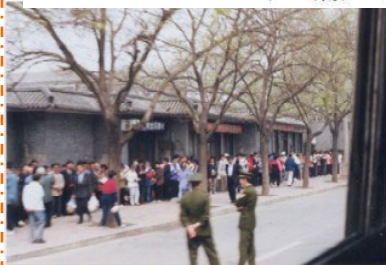
左图：执勤的警察在闲聊（注意群众身后不是紫禁城特有的红色围墙）