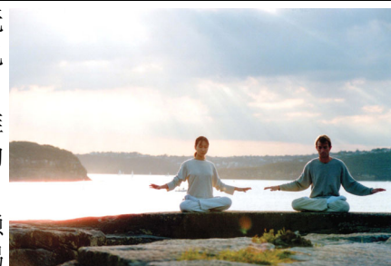
澳大利亚法轮功学员在炼功

我联想到他的病症，渐渐明白了病因。中医认为痢疾是气滞成积，积久成痢，其原因是脾虚而衰，而脾主