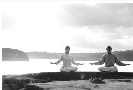
澳大利亚法轮功学员在炼功

我联想到他的病症，渐渐明白了病因。中医认为痢疾是气滞成积，积久成痢，其原因是脾虚而衰，而脾主