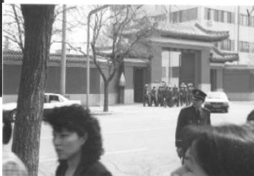
右图：和上访群众隔街相望的是中南海西门（这里可以看到紫禁城的红色围墙）

编者：从这些图片中我们很难看出“围攻”，而且上访的地点也不是中南海，而是相邻中南海的“西安门大街”，是当时国务院信访局的所在地。中国设立信访制度的本意，是为了使群众疾苦有一个下情上达的渠道。上万名群众直接来到国家最高的信访部门，这在中国历史上还是第一次。◇