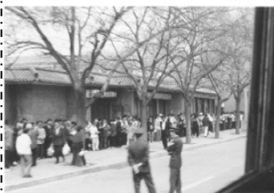
左图：执勤的警察在闲聊（注意群众身后不是紫禁城特有的红色围墙）