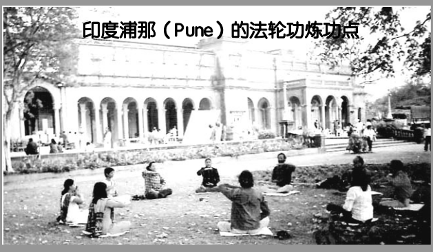
印度浦那 (Pune) 的法轮功炼功点