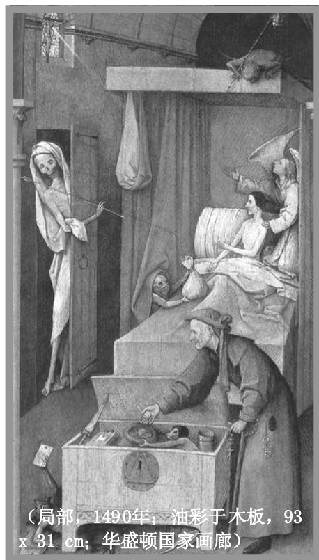
(局部, 1490年; 油彩于木板, 93 x 31 cm; 华盛顿国家画廊)

乙：“的确可恶！你有没有马上报警？”甲：“没有。我当他们是疯子，继续吹我的小喇叭。”——事出必有因，如果能先看到自己的不是，答案就会不一样。◇