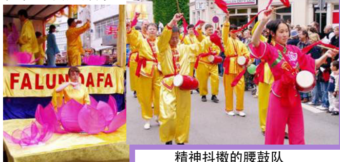
精神抖擞的腰鼓队

2005年6月4日，德国比勒费尔德第九次文化节隆重举行。70个团体的大约1500个表演者参与了这次游行。法轮功学员已是第二次参加这个文化节游行。法轮功学员的队伍展示的中国传统文化成为游行中一道亮丽的风景线，特别吸引了人们的注意。很多人跟着鼓点鼓掌，有一位中国男士大声叫好。一位中年男士觉得“法轮大法好”的音乐特别悦耳好听。观众们也很愿意接收法轮功真象资料和学员们用纸叠的莲花。◇