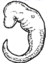
海克爾绘制的人类胚胎