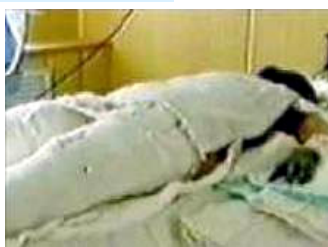
中央台“天安门自焚案”中的“烧伤病人”

人们在此次受难者深表关切的同时，细心者更是从新闻报道中恍然大悟，发觉四年前CCTV曾大肆报道的所谓“天安门自焚案”确实大有蹊跷。