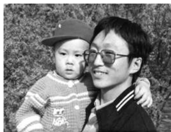
父子在一起的快乐时光

小家瑞经历了他这个年龄不该经历的一切，多了些他这个年龄不该有的沉默、忧郁，时常一个人默默流泪。