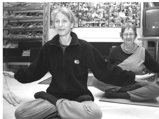
芬兰人在学炼法轮功第五套功法