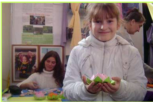
象征修炼人出淤泥而不染的莲花深受喜爱

2005年10月中旬，俄罗斯下诺夫果勒德城的“回归自我之路”健康展中，介绍法轮大法的图片展板吸引了众多的观众，人们高兴的索取法轮功真象传单和漂亮的纸折莲花，对法轮功功法饶有兴趣的