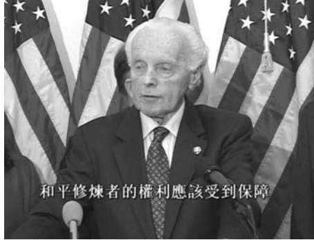
加州众议员兰托斯

【明慧网】2005年11月9日，在美国总统布什访华前夕，美国国际宗教自由委员会及数位国会议员，在美国国会山庄举办记者招待会，发布《关于中国人权策略的报告》。发布