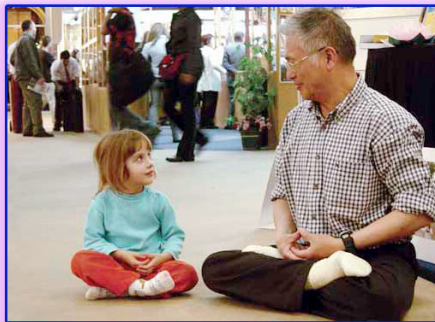
上图：善良无罪，修炼无罪。

一天午后，他正在躺椅上打盹，朦胧之中，忽见一位银须白发老翁，手拿拂尘飘然来到他的跟前，对他说：“我乃药神是也，统管天下采药卖药之人，你近来掺卖劣质药材，坑害病人，现在无人买药，就是对你的惩罚。”说罢，给他丢下一张纸条，遂又飘然而去。他急忙拾起纸条一