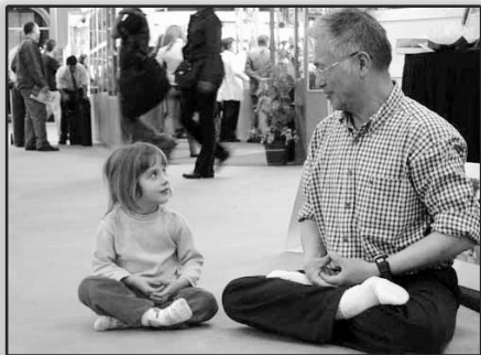
上图：善良无罪，修炼无罪。

一天午后，他正在躺椅上打盹，朦胧之中，忽见一位银须白发老翁，手拿拂尘飘然来到他的跟前，对他说：“我乃药神是也，统管天下采药卖药之人，你近来掺卖劣质药材，坑害病人，现在无人买药，就是对你的惩罚。”说罢，给他丢下一张纸条，遂又飘然而去。他急忙拾起纸条一