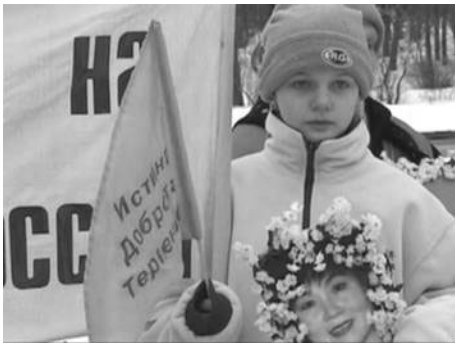
俄罗斯法轮功学员中领馆前抗议迫害

嘿，这个“阿米尔梯队”可不简单，他们整齐、迅速、灵活。在莫斯科讲真相有他们，在圣彼得堡讲真相