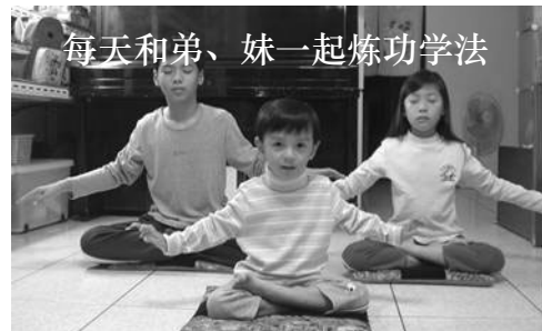
每天和弟、妹一起炼功学法

无病一身轻的感觉真好！六年了，法轮大法带给我们全家健康的身心以及祥和的家庭气氛。就我个人而言，失而复得的健康更是千金难买的。我想把发生在自己身上的这个真实的故事讲给每一个有缘的朋友，希望大家都能来分享“真、善、忍”法理带给世界的幸福与美好。◇