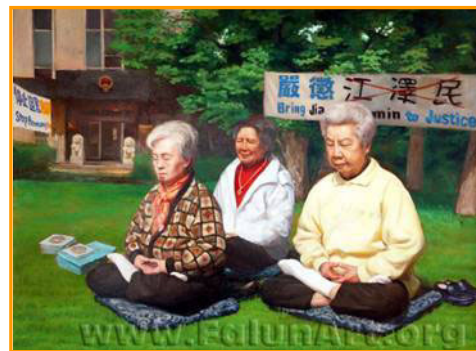
▲油画《正义之场》，董锡强，48 in x 36 in, 2004

一位风烛残年的老人，与世无争，只不过想做一个好人，得到一个健康的身体安享晚年，哪知在中共的高压下，好人却处处遭难。在中国，有数十万象王平均一样的好人被劳教被判刑，三千多人被迫害致死。江泽民及其帮凶已被告上国际法庭，必将受到法律的严惩，天灭中共是历史的必然，乌云不会永远遮住太阳。◇