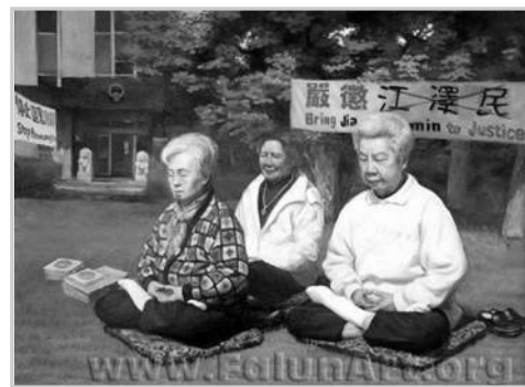
▲油画《正义之场》，董锡强，48 in x 36 in, 2004

近六年来在世界各地的中国大陆驻外大使馆、领馆前每天都有坚持不懈的法轮功学员和平请愿的场景，他们默默地告诉世人“法轮大法好”。天长日久，感动了世人，成为许多城市的一道风景。这幅画里的一群炼法轮功的老妈妈是在中国驻美大使馆前的草坪上炼功。◇