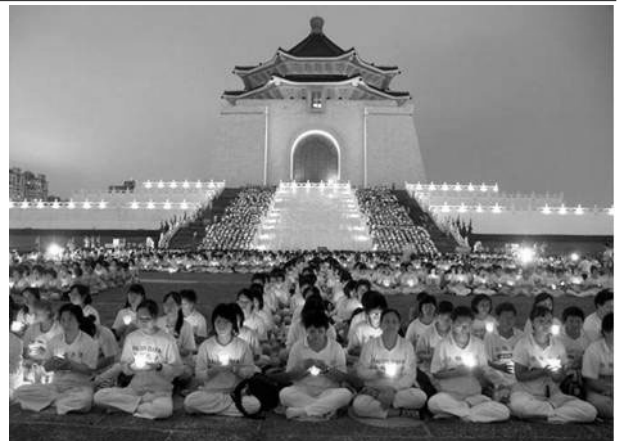
▲台湾五千法轮功学员2004年7月17日烛光守夜，悼念在大陆被迫害致死的同修。

我知道现在医院还有法轮功学员被关押，我希望这个事情能够尽快在国际社会上曝光，能营救这些还没有被杀死的人。另外，我希望能够将事情曝光，为我的亲人赎罪！”◇