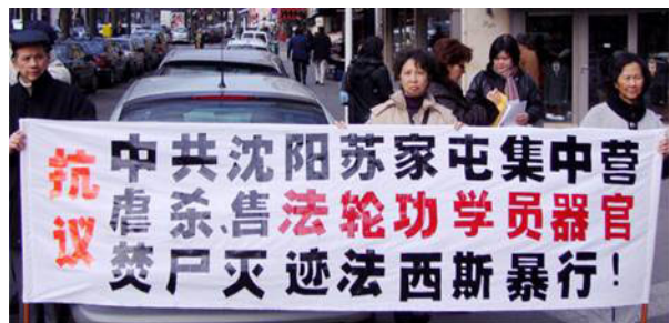
法国学员中使馆前呼吁停止迫害

■ 全球抗议苏家屯秘密集中营暴行： 惊闻“苏家屯秘密集中营”活体摘取、出售法轮功学员器官、并焚尸灭迹的暴行，全球法轮功学员及正义人士纷纷以各种不同的形式揭露中共的罪恶，呼吁国际社会展开调查，共同制止残忍的虐杀和迫害。