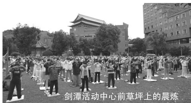
剑潭活动中心前草坪上的晨炼

大声，不过她马上意识到自己是个修炼人，这么点小事都过不去，马上很虚心的说，下次改