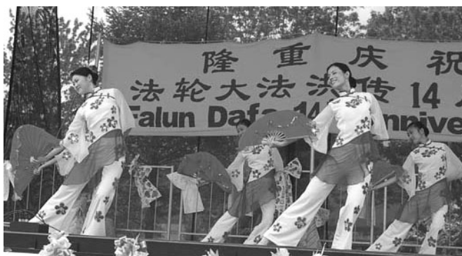
图：加拿大欢庆大法日，法轮功学员表演梅花舞

七载风雨过 一朝邪灵灭 法传六大洲 梅开亿万朵 好人得新生 觉者成正果 叩头谢师恩 仰天思故国 法正人间日 全球审江罗