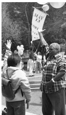
民众学习炼功动作

最后，主持人感谢大家参加“第七届世界法轮大法日”的庆祝活动。全体法轮功学员同声祝颂“师父生日快乐”。◇