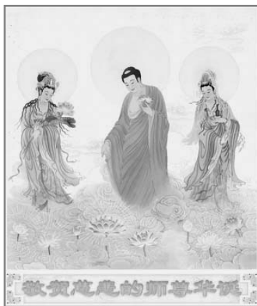
中国大陆法轮功学员 绘画：慈悲洒甘露

大法所到之处，福泽苍生，礼义圆明。亿万亲身受益的修炼者，用尽人间的语言，也无法表达对大法师父的感恩。大法修炼者相信，走过这段迫害的历史，善良的世人会越来越看到大法的殊胜和辉煌，五月十三日也将会成为全人类共同纪念的神圣节日。◇