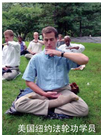
美国纽约法轮功学员

我感动之余要留他吃顿饭表示感谢,他谢绝了,给他买了一包最好的烟,他不会抽也不要。他说“这不算什么,只要是学法轮大法的,每一个人都会这样做。”以前我不了解法轮功,听信了电视报纸的歪曲报导。这次亲身经历让我明白了,现在人群当中只有法轮功学员具有这么高尚的品德和这么美好的心灵!中共的报纸和电视都是骗我们老百姓的。◇