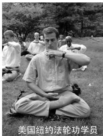
美国纽约法轮功学员

我感动之余要留他吃顿饭表示感谢,他谢绝了,给他买了一包最好的烟,他不会抽也不要。他说“这不算什么,只要是学法轮大法的,每一个人都会这样做。”以前我不了解法轮功,听信了电视报纸的歪曲报导。这次亲身经历让我明白了,现在人群当中只有法轮功学员具有这么高尚的品德和这么美好的心灵!中共的报纸和电视都是骗我们老百姓的。◇