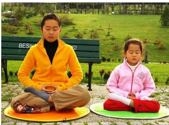
▲认真炼功的土耳其法轮大法小弟子

忍”落实在日常生活，我便再也不向同学借作业来抄袭。修炼后，再一次遇到集体作弊的情况时，正当心中又有所挣扎时，我突然想到：我是一个炼功人啊！我应该堂堂正正、光明磊落，这样的一件小事我有什么好疑惑的呢？这样的念头一起，我的心便能坚定下来。后来，我都能非常自在坚决地拒绝同学们作弊的邀约，而心中