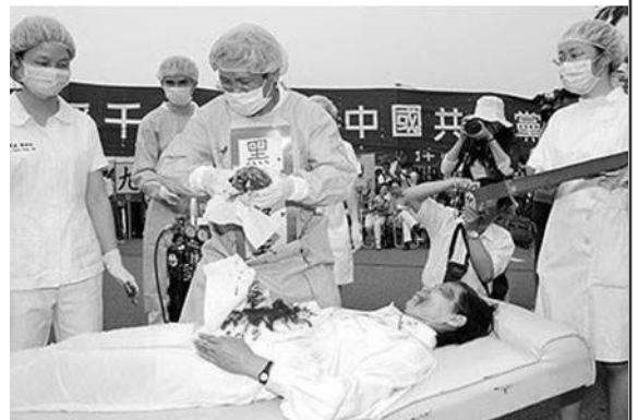
▲模拟中共“活摘法轮功学员器官”

乔高表示当他听到一位中国女士的证词，述说她的丈夫——一位眼科医生在到2003年为止的两年间参与了从约2000名被麻醉的法轮功学员身上摘取眼角膜的事实后，感到颤栗。