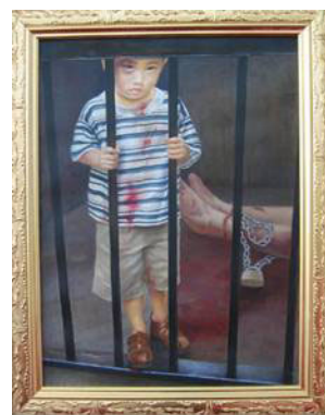
▲《为什么》，油画 汪卫星，2004

善良的人们，有谁能救救月童一家？月童想回家，想和爸爸妈妈一起回家，她已经到了上学的年龄了，她该上学了……◇