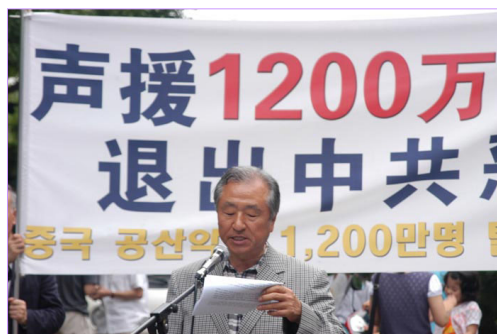
韩国集会的另一主题：声援 1200 万人公开上网声明退党（团、队）

两国民众纷纷谴责中共比当年纳粹还残忍的暴行。一位南姓老人（77 岁）在韩国集会现场向记者表示，“了解到中共这些恶行，尤其是活体摘取贩卖法轮功学员器官一事，我很是震惊，心里很不安……你们要多努力些”一位韩国警察说，“你们做的都是好事，除了游行，若还有别的办法更好。”