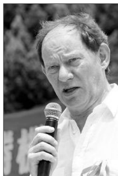
斯考特先生宣布加入“法轮功受迫害真相联合调查团”

斯考特先生接受采访时说：“欧洲议会曾再三对法轮功在中国遭受的对待表示关注，那是极为糟糕的状况。我来到这里，表达我的深切关注，并警告那些要负上责任的人，他们在适当的时候会被绳之以法。”◇