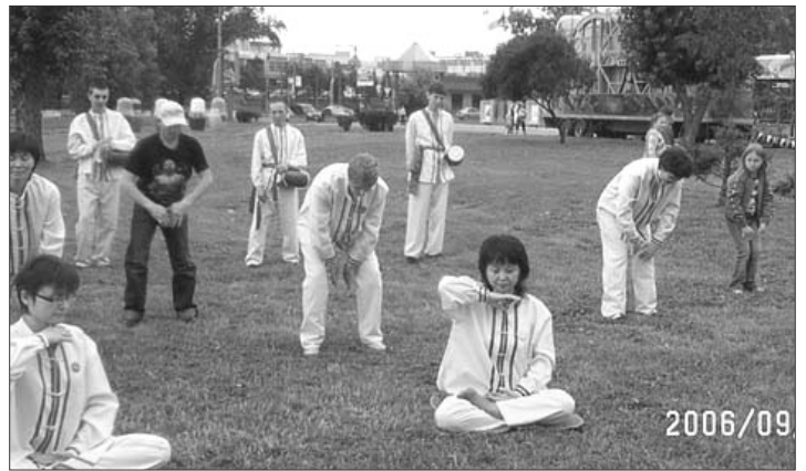
莫斯科城市节上，一大一小两位观众当场学炼法轮功