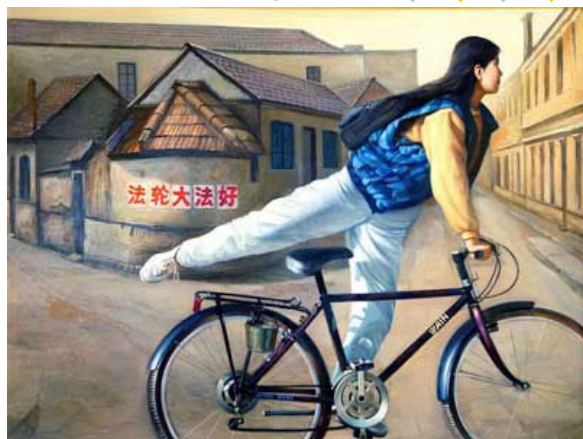
作者：董锡强，油画 48英寸x 36英寸（2004）

你那轻盈的身影，穿梭在大街小巷 你是坚贞的信使，无论酷暑寒冬 面对暴力与危险 你只有静静的微笑 送给人们最珍贵的福音： 法轮大法好！