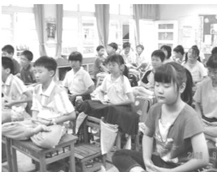
▲台湾嘉义市兴嘉国小法轮功社团