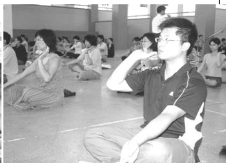
▲台湾南桃园法轮功教师研习营

现在，法轮功洪传世界80多个国家，在我们台湾无论幼儿园、小学、中学、大学都有越来越多老师和同学都开始修炼法轮功，从此生活变得健康充实。我祝愿更多大陆的孩子们也能早日得到这珍贵的功法，来亲身体会法轮功的神奇。◇