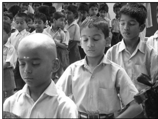
▲图片中央的这位印度男孩子修炼法轮功两个月了，他说：“法轮大法使我变得很强壮。我讷于言辞，但是实际的改变非常巨大”。

【明慧网】在印度，现在已有至少三十几所学校的成千上万的师生在修炼法轮功。法轮功为什么在印度学校有这么大吸引力呢？仅来看看下面的一个例子吧：一所寄宿学校的师生炼功仅仅一个学期后，该校就有了神奇的经历：百分之百的学生通过了考试，而通常的合格率只有百分之五十左右。校长因此深信大法，自己也开始认真的炼功了。很快，折磨了他四十年的哮喘病不翼而飞。四年以来，该校每天早上和下午分别炼功三十分钟。