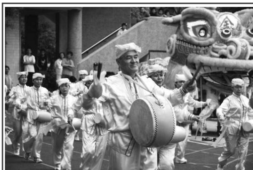
二零零六年十一月十二日在台湾桃园县芦竹乡山脚国中举办每两年一次的“全乡暨长青运动大会”，来自芦竹乡各村、社区及公所等五十三个团体参加，与会者从乡长、议员、乡民代表到乡民、学生等达四千多人，可谓当地一大盛事。法轮功学员受邀在运动会中表演功法及腰鼓。上图是法轮功腰鼓队员精神奕奕，鼓声震天。

生活中，生命中，真正的宝不是钱财，是真正能够给你带来幸福、福分的东西。请朋友珍惜机缘，也常念诵“法轮大法好，真、善、忍好”，定有福报。◇