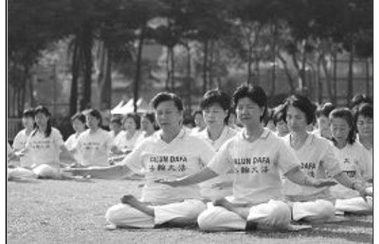
二零零六年香港法轮大法修炼心交流会，十一月十一日在九龙太子明爱服务中心礼堂成功召开。上图为交流会期间，逾千学员在维多利亚公园集体炼功，组成“正法”两个字，下图为交流会期间学员集体炼功。