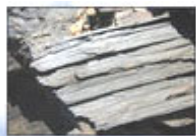
▲美考古学家在亚拉拉特山发现的木板

很多人识破天机，退出了那条红色恶龙——中共，如今在海外大纪元网站声明退出党、团、队的人数已经超过了1500万！他们都登上获救的方舟，明智的朋友，您还等什么？◇