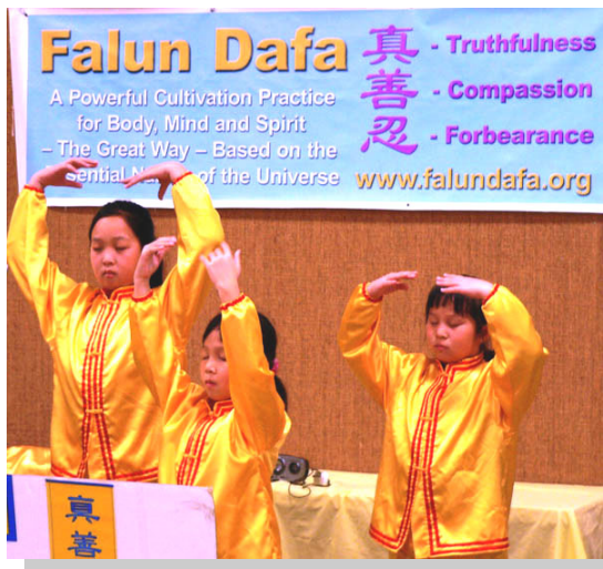
▲法轮大法小弟子们在演示功法

【明慧网】二零零六年十一月四、五日，为期两天的美国堪萨斯州托匹卡市身心健康集会上，当地居民欣喜地发现了一种使人获得身心健康的功法——法轮功。