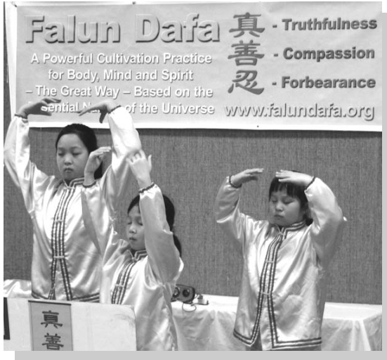
▲法轮大法小弟子们在演示功法

【明慧网】二零零六年十一月四、五日，为期两天的美国堪萨斯州托匹卡市身心健康集会上，当地居民欣喜地发现了一种使人获得身心健康的功法——法轮功。