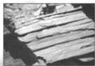
▲美考古学家在亚拉拉特山发现的木板

很多人识破天机，退出了那条红色恶龙——中共，如今在海外大纪元网站声明退出党、团、队的人数已经超过了1500万！他们都登上获救的方舟，明智的朋友，您还等什么呢？◇