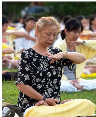
▲晨炼中的台湾法轮功学员

法轮大法好，是真的。赞叹师尊之伟大、佛法之精深玄奥。今生何其有幸能得法，想不到因祸而得福。人生命的意义、生活的目的地为何？我终于在《转法轮》中找到答案。我学法炼功已八个月，天天幸福洋溢、快乐满足。感恩师尊的慈悲救度，颇有相见恨晚之憾。朋友们别迟疑！快加入修炼的行列吧！◇