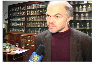
万可润可斯文参议员就制止中共器官贩卖接受记者采访

人权组织已经尖锐的批评了部份器官的来源。这些器官有可能是从死刑犯身上摘取所得，并高额出售。但这并不能解释所有的器官来源。万可润可斯文先生说：“如果你把在中国的器官移植数量和官方报道的死刑数量作比较，你就会发现还有大约六千例的差距。”