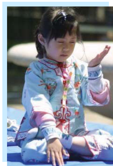
图片赏析——纯 套功法——神通加持法 美国德州拉伯克爱弗兰斯报第五版

爱因斯坦对这个问题的态度很明确，他说：“我相信个人应当根据他的良心行事，……”他还说：“我想做的事，不过是要以我微弱的能力来为真理和正义服务，准备为此甘冒不为任何人欢迎的危险。”◇