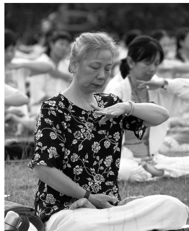
▲晨炼中的台湾法轮功学员

法轮大法好，是真的。赞叹师尊之伟大、佛法之精深玄奥。今生何其有幸能得法，想不到因祸而得福。人生命的意义、生活的目的地为何？我终于在《转法轮》中找到答案。我学法炼功已八个月，天天幸福洋溢、快乐满足。感恩师尊的慈悲救度，颇有相见恨晚之憾。朋友们别迟疑！快加入修炼的行列吧！◇