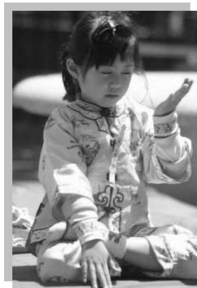
图片赏析——纯 套功法——神通加持法 美国德州拉伯克爱弗兰斯第五报

爱因斯坦对这个问题的态度很明确，他说：“我相信个人应当根据他的良心行事，……”他还说：“我想做的事，不过是要以我微弱的能力来为真理和正义服务，准备为此甘冒不为任何人欢迎的危险。”◇