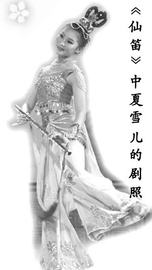
《仙笛》中夏雪儿的剧照

我写出这段经历，是希望与大家分享喜悦，同时也希望大家能记住“法轮大法好”这句话，希望大家万事如意。◇