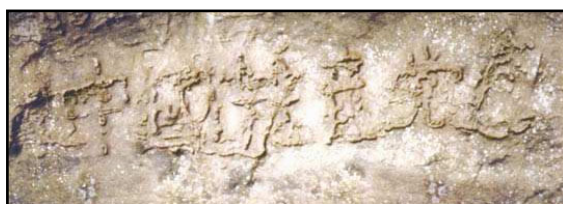
▲贵州平塘县的掌布乡自然形成的“藏字石”：中国共产党亡

虽然此后还有其他王朝把长城作为防御工程而加以修补与扩展，但是万里长城真正背负的却是上天对中国人的重大警示：遵循天意，天意不可违。◇