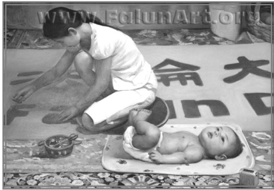
油画《横幅》，董锡强，48 in x 36 in (2004)，年轻的母亲一边缝制中、英文的“法轮大法好”的横幅，一边在听法轮功师父的讲法。孩子似乎也听得入了神。

吃完早饭是妈妈炼功的时间，成成可喜欢看妈妈炼功了，他坐在地上，仰着小脸，睁大了眼睛，目不转睛的盯着妈妈的每一个动作，成成最爱看的就是第一、三和四套功法，第二、五套功法，妈妈要么是站桩，要