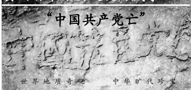
贵州省平塘县发现的藏字石：

“无信不立”。可见一个人也好，一个团体，甚至一个政党、党派也好，失了“信”也就失去生存的机会。共产党迫害正信的人怎么能长了呢？！◇