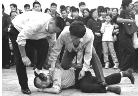
天安门广场便衣正在暴打法轮功学员

编注：“六一零”办公室为迫害法轮功的专门机构，凌驾于宪法和法律之上，相当于文革时期的“中央文革领导小组”和二战时纳粹希特勒的“盖世太保组织”。◇