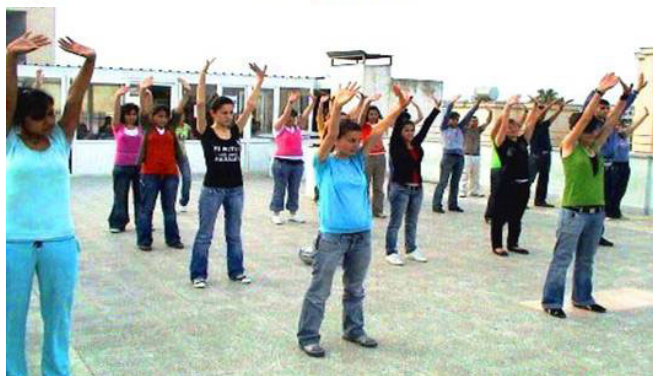
土耳其学生学炼法轮功

【明慧网】二零零七年五月六日，应墨尔逊市Bilge Elit Dershanesi学校校长的邀请，两位法轮功学员在该校举办了一场关于法轮功的专题介绍会并现场教功。