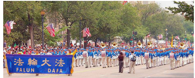
▲法轮功学员的精美花车和气势恢宏的“天国乐团”