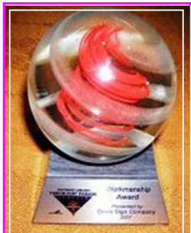
法轮功「大法船」花车荣获最佳「制造工艺」奖

【明慧网】第五十八届“海洋节炬光游行”于七月二十八日晚在西雅图市中心的大道上举行。在现场三十万观众的欢呼声中，在电视机前七十万观众的期待中，法轮功队伍以气势磅礴的二百人阵容，展现了从现代西方文明到东方神传文化、从人间至天国的美好景象。法轮功浩浩荡荡的“天国乐团”令人赞叹不已；恢宏精美的“大法船”更令人叹为观止。电视七台评论员向观众介绍时说，“这是从古老庄严的唐朝直接驶来的法轮功‘大法船’花车。她获得了今年的最佳‘制造工艺’，非常绚丽多彩，具有非常的想象力！”◇