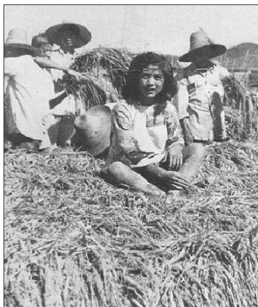
▲当年中共报纸上刊登的“卫星田”照片，田里的稻谷厚到小孩可以在稻穗上爬。让人不解的是，这样的稻田如何管理呢？

一九五八年八月，《人民日报》发表社论，称“人有多大胆，地有多大产”、解放了的人民可以创造出史无前例的奇迹。广西环江县水稻亩产十三万斤的“奇迹”就是在中共这样的鼓动宣传下创造出来的。